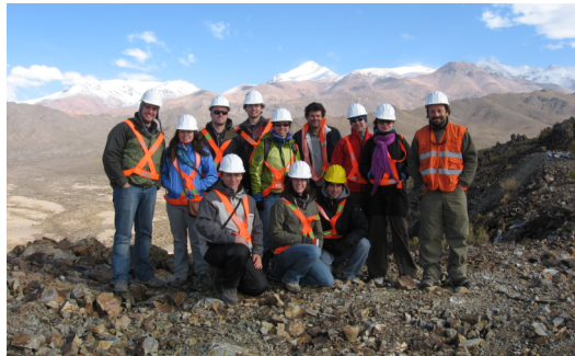
Chapitre Étudiant de la SEG en Argentine (Mai 2010)

Nous désirons également offrir deux places aux professionnels de l'industrie intéressés d'en apprendre plus sur la géologie économique bolivienne, son contexte minier actuel et sur la géologie unique et fascinante d'un arc volcanique continental actif. Le chapitre s'occupe de toute la logistique de l'excursion et nous demandons une contribution financière du participant d'environ 5000 $ mais qui peut-être ajustée dépendant des coûts des billets d'avion et des aspects logistiques locaux (transport, hébergement et nourriture). Notez également qu'un logement séparé et confortable sera garanti aux professionnels qui se joindront l'excursion.